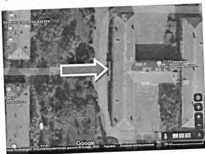
в) інші матеріали, суттєві для поданого проекту (креслення, схеми тощо) - .....